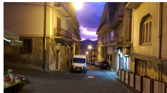
Alleine auf dem Nachhauseweg

Sowohl durch das große Angebot an regionalen und saisonalen Produkten und der generell traditionellen Erntemethoden als auch durch die vielseitige Auswahl an Alternativen fiel es mir ziemlich leicht einen nachhaltigen Lebensstil mit pflanzlicher Ernährung zu pflegen ohne großen Überfluss und mit sehr viel naturnahen Erlebnissen. Im Laufe meines Aufenthalts verbesserten sich meine Italienischkenntnisse und verstärkten sich die Freundschaften stetig. Nun da das Auslandsjahr durch äußere Umstände leider auf nur acht Monate verkürzt wurde und es im April sein Ende gefunden hat, wird mir klar wie viel mir die ganze Erfahrung gebracht hat, von familiären Verhältnissen aus denen Freundschaften erwachsen, bis hin zur Möglichkeit das eigene Leben umzugestalten, um zu etwas gutem beizutragen indem man eigenen Verzicht übt und positiven Einfluss auf seine Umwelt hat. Es war ein unvergessliches Erlebnis welches mich in meiner Entwicklung sehr geprägt hat und ich bedanke mich bei all meinen Mitvolontären, Kollegen und Freunden.