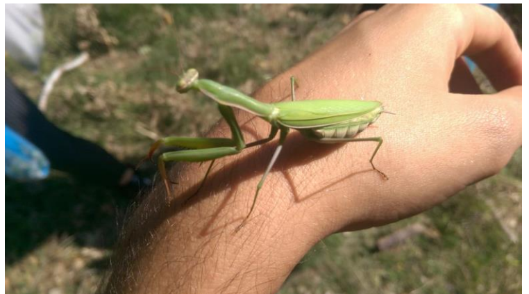
Mit Gottesanbeterin beim Sammeln von Samen